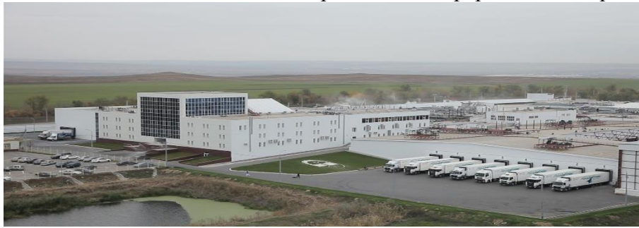
Рисунок 2. Общий вид ООО МК «Дубки»