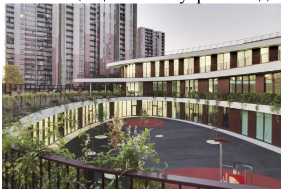
Рисунок 6 – Внутренний двор школы в Париже

Studio, представляет собой трехэтажное здание с многоуровневой «зеленой» крышей, и фасадом, оформленным чередующимися деревянными панелями. Каждый уровень объекта спроектирован таким образом, чтобы максимизировать приток солнечного света во внутренние помещения, с этой же целью было установлено панорамное остекление. Спиральная форма здания образует уютный и защищенный внутренний двор» (см. Рисунки 6-8) [3].