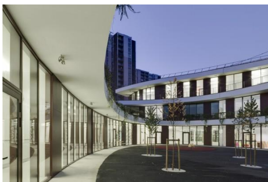
Рисунок 8 – Фрагмент внутреннего двора в школе Парижа