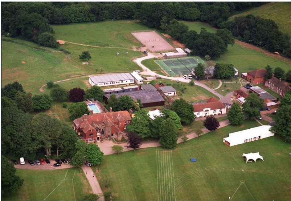
Рисунок 9 – Международная школа-пансион Buckswood school

Таким образом, проведя оценку территорий зарубежных школ нами установлено, следующее: