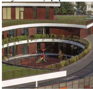
Рисунок 7 – Детская площадка во внутреннем дворе школы в Париже