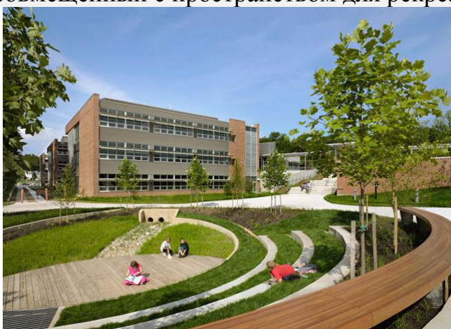
Рисунок 4 – Амфитеатр

Школа расположена в Вирджинии, США. Общая площадь полов составляет 13 000 м 2 . «Природный мир является важным фактором для здорового развития детей, поэтому из всех комнат открывается вид на дубовый лес. Кроме того, учителя создали новые образовательные программы, направленные на создание тесной связи детей с природой» [2]. Ещё значительным фактором было участие учащихся и преподавателей в процессе «зеленой» реконструкции. Одно из общественных пространств является амфитеатр, где проходят театральные и иные мероприятия, а также используются как игровая территория. Во внутреннем дворе школы – огород совмещенный с пространством для рекреации (см.Рисунок 4-5).