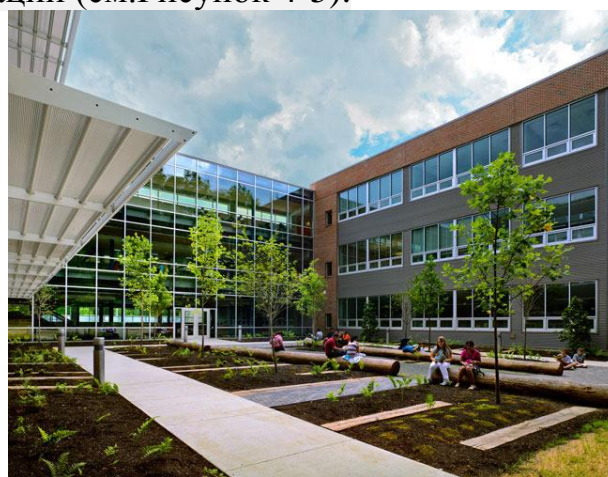
Рисунок 5 – Внутренний двор

«Городке Бобиньи, расположенном к северо-востоку от Парижа, был открыт новый школьный комплекс. Проект, осуществленный компанией Mikou Design