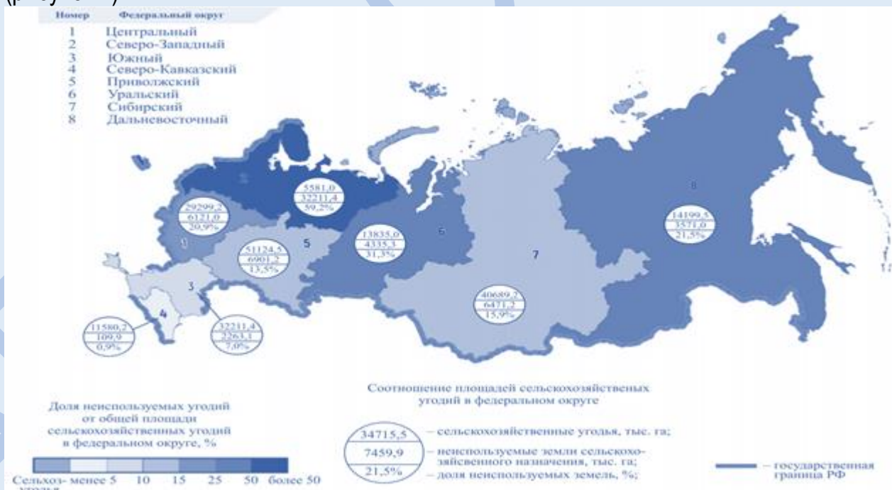
Рисунок 2. Количество и доля неиспользованных сельскохозяйственных земель по площади и по федеральным округам РФ

Кроме невостребованных земель в России высока доля неиспользуемых земель (рисунок 2).