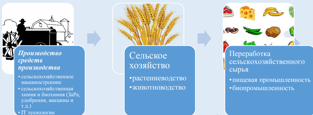
Рисунок 1. Основные сферы агропромышленного комплекса