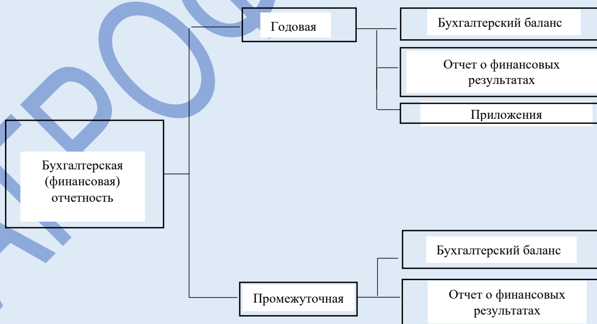
Рисунок 1 — Формы годовой и промежуточной бухгалтерской (финансовой) отчетности в Российской Федерации.