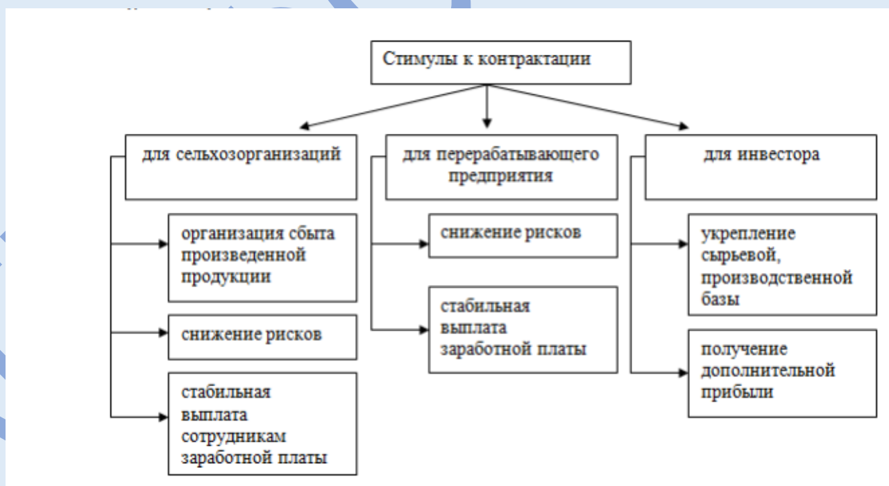
Рисунок 1 - Схема стимулов субъектов сельскохозяйственной отрасли к контрактации