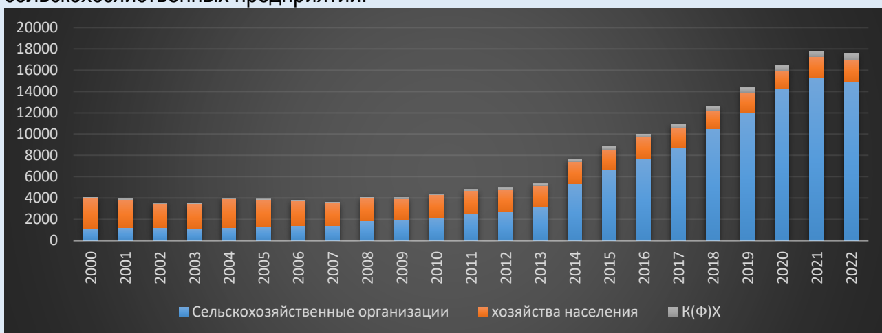
Рисунок 2. Динамика реальной стоимости продукции сельского хозяйства Псковской области с 2000 по 2022 годы в ценах 2000 года по категориям хозяйств, млрд. руб.

производства? По первоначальной динамике виден рост доли производства сельскохозяйственных предприятий.