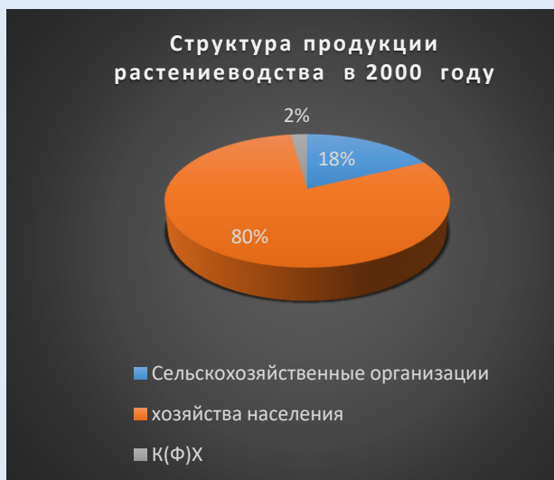
Рисунок 7. Структура производства продукции растениеводства в Псковской области в 2000 году Источники: [5,6]