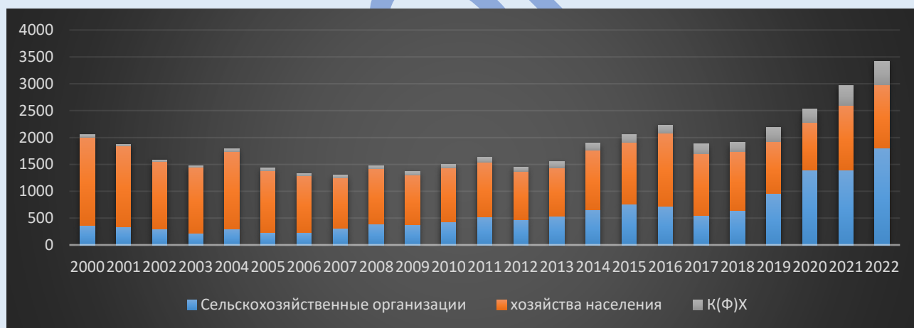
Рисунок 6. Динамика стоимости продукции растениеводства Псковской области с 2000 по 2022 годы в реальных ценах 2000 года по категориям хозяйств, млрд. руб.

В отличие от общей стоимости всей продукции сельского хозяйства продукция растениеводства имеет равномерный рост в фактических ценах (рисунок 5) но при рассмотрении динамики на рисунке 6 основной рост стоимости стал наблюдаться только в период с 2018 года