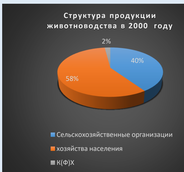
Рисунок 11. Структура производства продукции животноводства в Псковской области в 2000 году