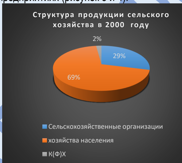
Рисунок 3. Структура производства продукции сельского хозяйства в Псковской области в 2000 году Источники: [5,6]

Как видно из динамики реальной стоимости, фактически продукция начала расти только после 2012 года, когда в регионе стали действовать меры государственной поддержки. Динамика стоимости показывает фактического роста продукции сельского хозяйства в сельхозорганизациях, низким уровнем производства в хозяйства населения и К(Ф)Х. При этом за 22 года произошла резкая переориентация производства продукции из производства в малых формах хозяйствования в производство в крупных и средних предприятиях (рисунок 3 и 4).