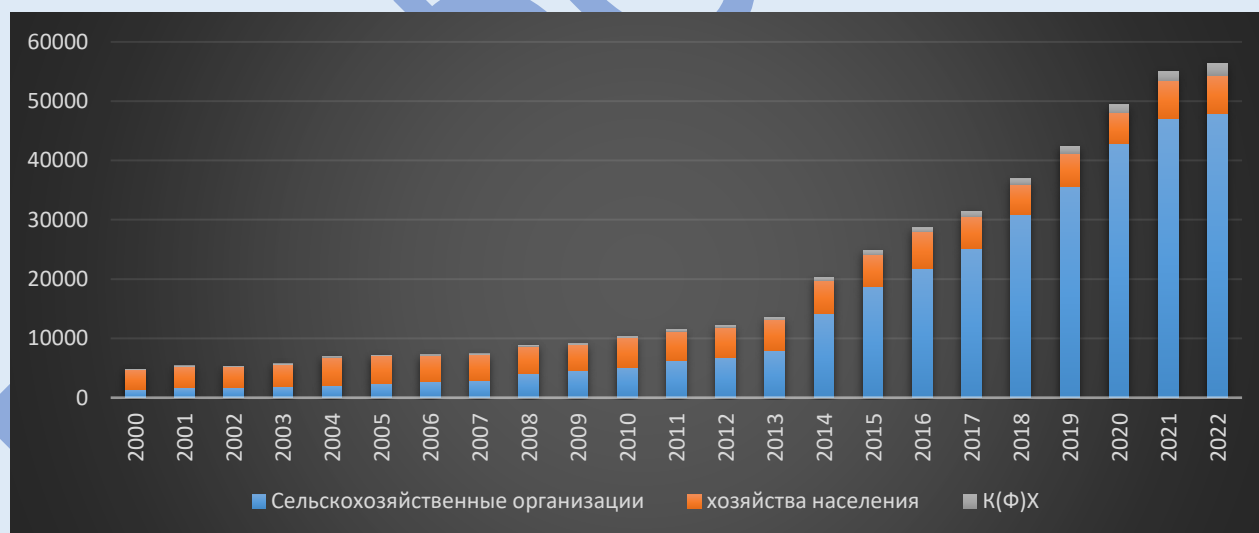
Рисунок 1. Динамика стоимости продукции сельского хозяйства Псковской области с 2000 по 2022 годы в фактических ценах по категориям хозяйств, млрд. руб.

Для характеристики рассмотрим динамику стоимости продукции сельского хозяйства.