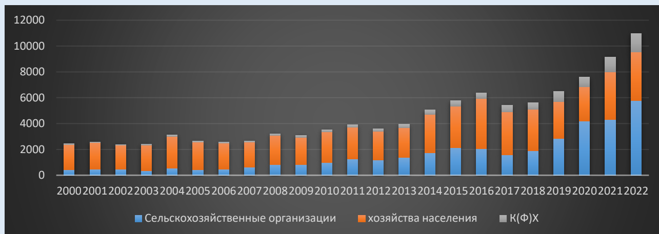
Рисунок 5. Динамика стоимости продукции растениеводства Псковской области с 2000 по 2022 годы в фактических ценах по категориям хозяйств, млрд. руб.