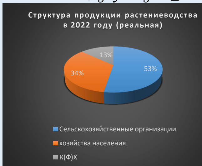
Рисунок 8. Структура производства продукции растениеводства в Псковской области в 2022 году

Рассмотрим динамику стоимости продукции животноводства Псковской области в фактических и реальных ценах 2000 года (рисунок 9 и 10).