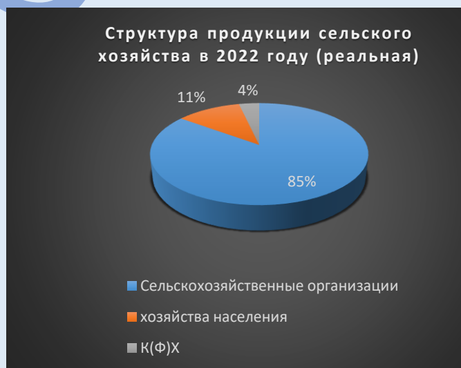
Рисунок 4. Структура производства продукции сельского хозяйства в Псковской области в 2022 году

Рассмотрим динамику стоимости продукции растениеводства Псковской области в фактических и реальных ценах 2000 года (рисунок 5 и 6).