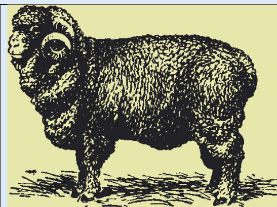
Рисунок 3. Бараны породы Рамбулье