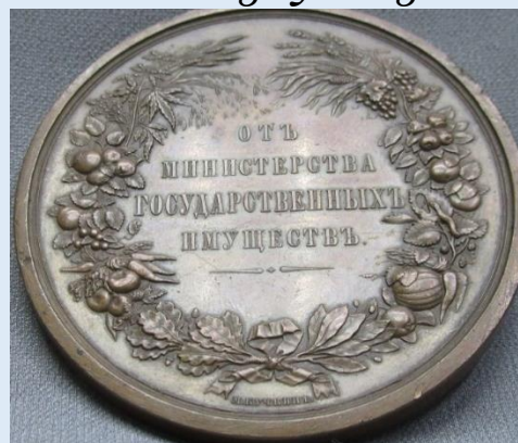
Рисунок 2. Медаль Министерства государственного имущества

От Министерства Финансов на фабричный отдел: