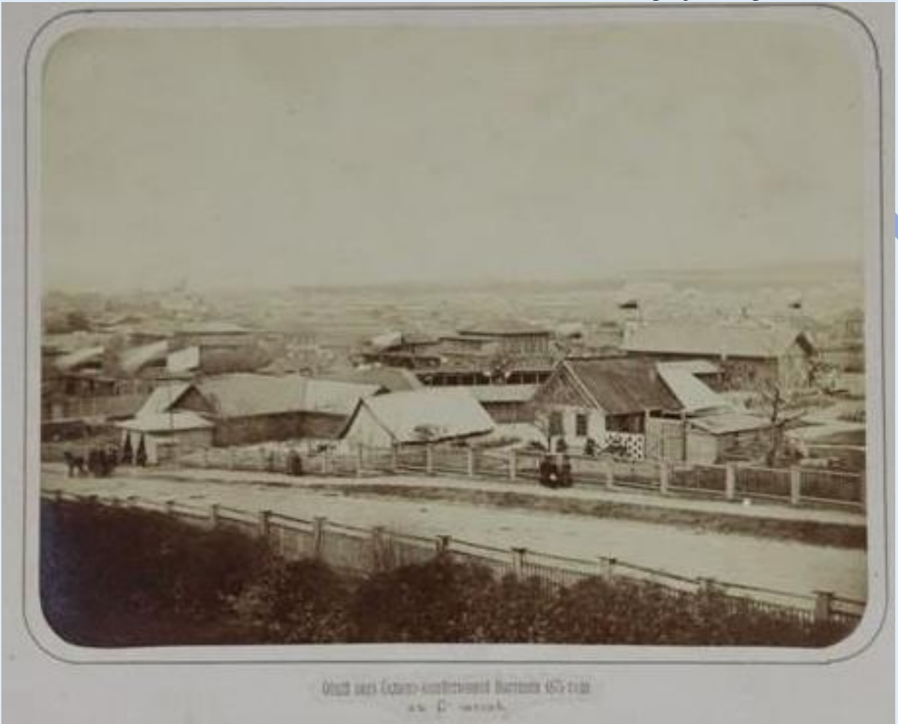
Рисунок 5. Общий вид выставки 1875 года в Саратове

Так как, выставка была направлена на компенсацию расходов для ее проведения, то мы видим экономических бухгалтерский баланс выставки (рисунок 9). Министерство государственных имуществ выделило на мероприятие 500 рублей, Саратовское губернское земство отпустило 4 580 рублей, весь расход на организацию выставки составил 6 631 рубль 74 копейки.