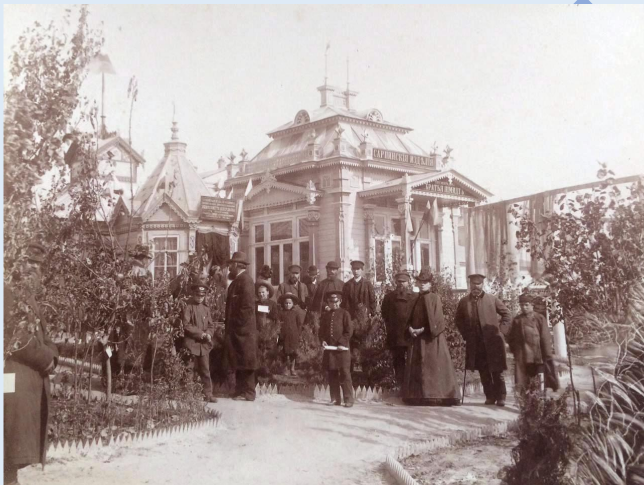
Рисунок 7. Фото с выставки 1875 года у павильона «Сарпинские ткани. Братьев Шмитт»

На выставке проводили испытания отечественной и заграничной техники и орудий.