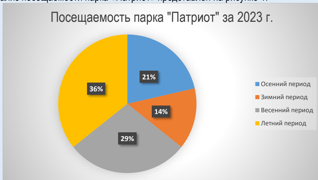
Рисунок 1- Посещаемость парка «Патриот» за 2023г.

Анализ посещаемости парка «Патриот» представлен на рисунке 1.