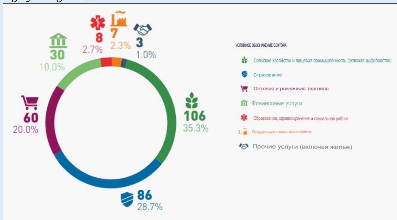
Рисунок 3. – Структура международной кооперации ТОП-300