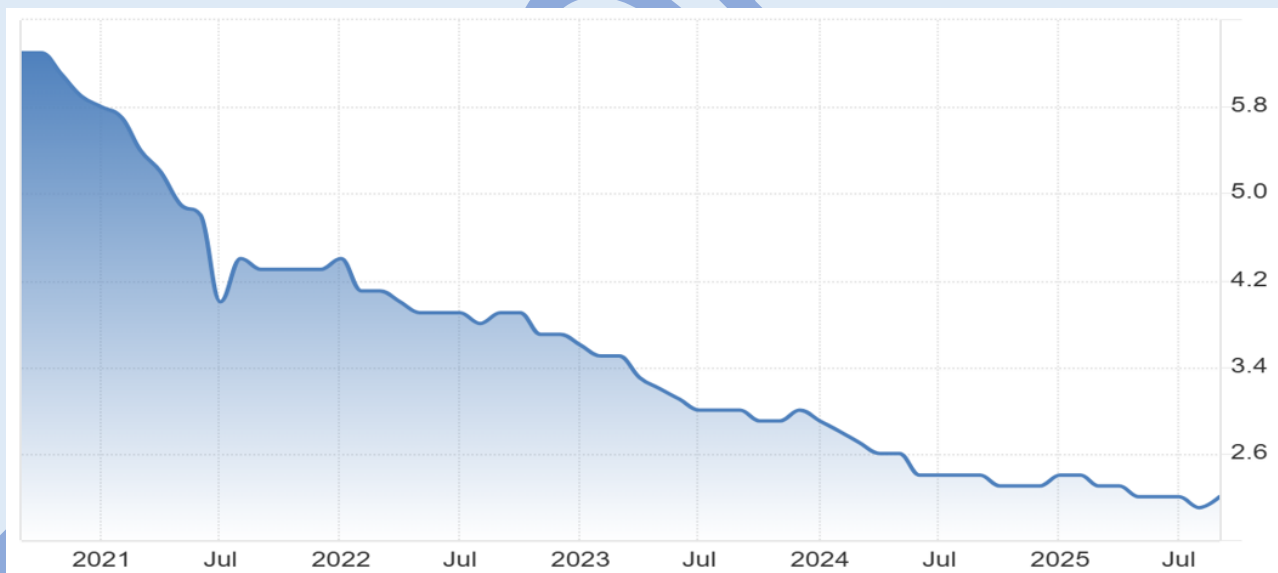
Рисунок 4 – Уровень безработицы в России в период с 2021 по 2025 [1]

Уровень безработицы сохраняется на рекордно низком уровне — около 2,2% по состоянию на август 2025 года [5]. Данный показатель свидетельствует о напряженности на рынке труда и создает риски инфляционного давления через опережающий рост заработных плат, реальный рост которых в 2024 году по данным Росстата составил 9,1%.