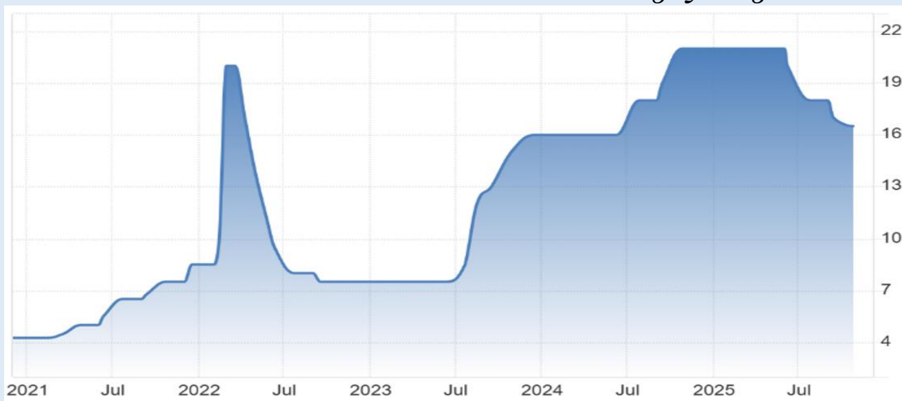
Рисунок 3 – Уровень ключевой ставки в России в период с 2021 по 2025 [1]

Уровень безработицы сохраняется на рекордно низком уровне — около 2,2% по состоянию на август 2025 года [5]. Данный показатель свидетельствует о напряженности на рынке труда и создает риски инфляционного давления через опережающий рост заработных плат, реальный рост которых в 2024 году по данным Росстата составил 9,1%.