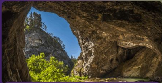
ПЕЩЕРА «ШУЛЬГАН-ТАШ» (КАПОВА)