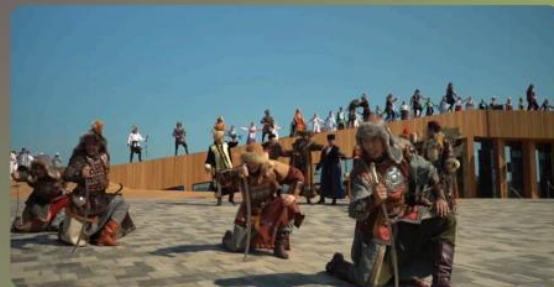
«ВИЗИТ-ЦЕНТР» ЕВРАЗИЙСКОГО МУЗЕЯ КОЧЕВЫХ ЦИВИЛИЗАЦИЙ, ЧИШМИНСКИЙ РАЙОН