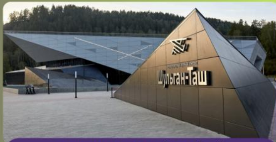
ИСТОРИКО-КУЛЬТУРНЫЙ МУЗЕЙНЫЙ КОМПЛЕКС «ШУЛЬГАН -ТАШ»