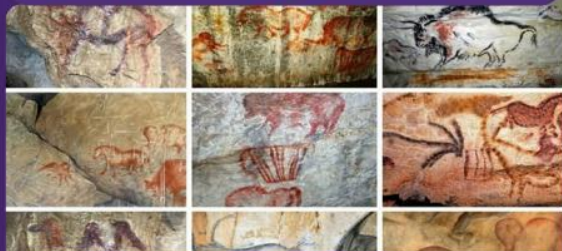
НАСКАЛЬНЫЕ РИСУНКИ ПЕРВОБЫТНОГО ЧЕЛОВЕКА ЭПОХИ ПАЛЕОЛИТА