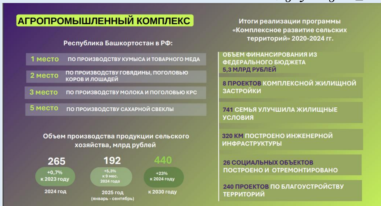
Рис. 1. Агропромышленный комплекс

Объем производства продукции сельского хозяйства вырос на 23% по сравнению с 2024 годом. Это показывает, что в Башкирии агропромышленный комплекс набирает обороты, растет объем производства.