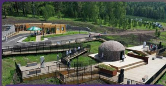
ИСТОРИКО-МЕМОРИАЛЬНЫЙ КОМПЛЕКС «САЛАУАТ ЕРЕ», САЛАВАТСКИЙ РАЙОН